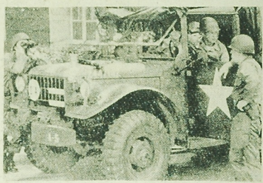
Zamieszki rasowe w Stanach Zjednoczonych. NA ZDJĘCIU: uzbrojeni żołnierze gwardii narodowej patrolują murzynską dzielnicę Minneapolis.

LONDYN (PAP) — W nadchodzący piątek parlament brytyjski rozpo- czyne sesję letnią. Ostatni system parlamentu będzie szczególnie trudnym okresem dla rządu labo- rystowskiego, który musi prze- bić sesję przed dwoma kłopotliwymi debaty: ekonomii i wojny.