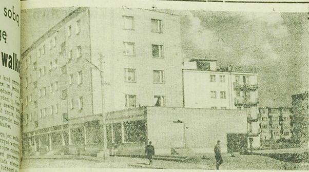
Odciec II w Szwabach.